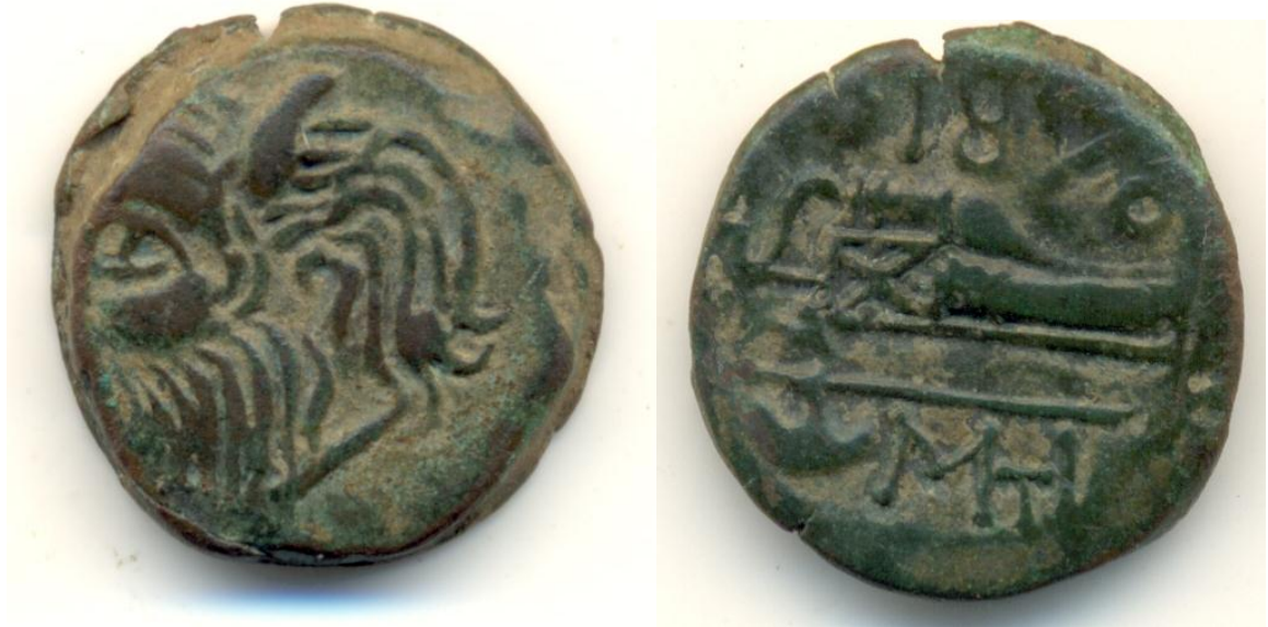
Мал. 3. «Борисфен» VIII групи з унікальним графічним варіантом монограми

більш вірогідними. Але, звертає на себе увагу той факт, що досить вузька група епонімів (218, 217, 216 та 213 pp. до н.е.) ідентифікується з іменами монетних магистратів на заключних випусках «борисфенів». Це є деяким підтвердженням нашої думки про карбування «борисфенів» аж до 217-216 pp. до н.е.