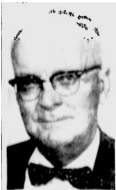
Фото. Філіп Мей Хамер [38].

1943 р. Президент Ф. Д. Рузвельт закликав державні установи зберігати звіти про виконання їх обов'язків у період Другої світової війни. Був сформований Комітет по зберіганню звітів державних установ воєнного періоду. 4 червня 1946 р. Президент Г. С. Трумен (1945-1953) звернувся до Архівіста США С. Дж. Бакка і доручив йому укласти довідники архівних документів воєнного часу [15]. Під керівництвом Ф. М. Хамера [16] 1947 р. було здійснене видання «Федеральні документи Другої світової війни» [17], 1948 р. світ побачив перший Путівник по документах Національного архіву [18], що містив інформацію про майже 800 тис. куб. футів документів, які знаходились на той час на зберіганні у NARA. Співро-