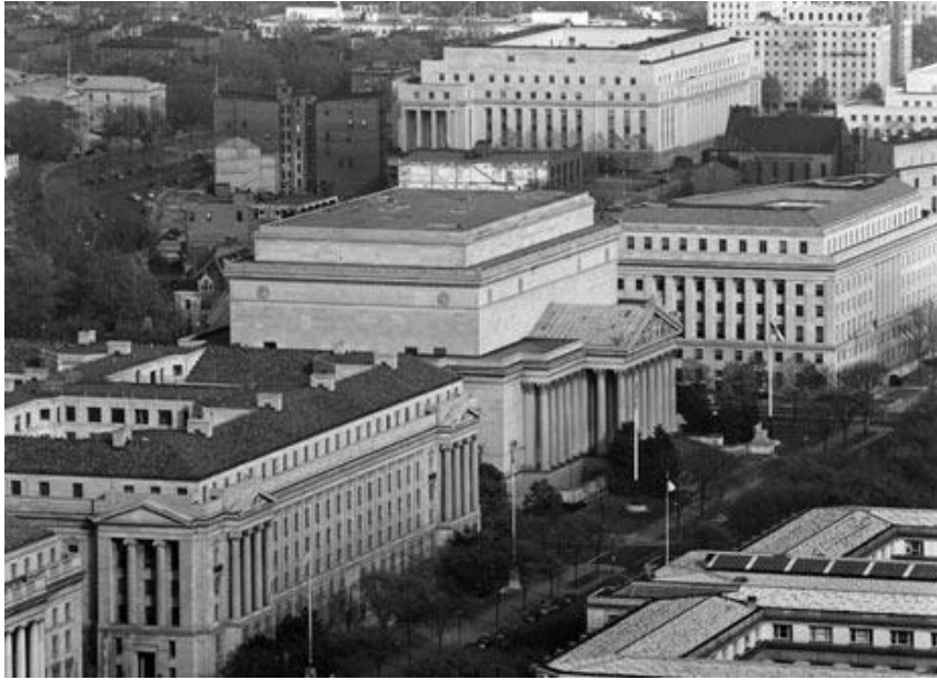
Фото Будинок Національного архіву (в центрі фото), 1951 р. [32].

У грудні 1949 р. у структурі NARS був створений Відділ з управління документацією (Records Management Division), 1950 р. Конгрес прийняв Закон про федеральні документи «Federal Records Act» (PL 754, 81 st Congress), у кожному федеральному відомстві були впроваджені програми управління документацією, згодом відкриті федеральні центри документації для зберігання не поточних документів федеральних агенцій. На 30 червня 1954 р. 95 % федеральних департаментів прозвітували про розроблення і впровадження конкретних переліків документів, утворюваних в їх відомствах зі строками зберігання і встановленими процедурами виділення нецінних документів до знищення [33].