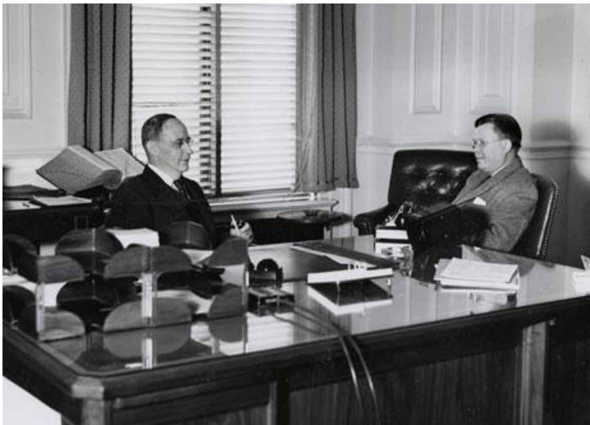
Фото. 2-й Архівіст США С. Дж. Бакк (зліва) та 3-й Архівіст США У. К. Гровер (з права), 20 травня 1948 р. [27]

З огляду на внесені пропозиції Комісія 12 квітня 1948 р. підписала угоду з Е. Ліхі та Національною радою з управління документацією про вивчення проблеми управління документацією у федеральному урядові. У звіті Ліхі від 14 жовтня 1948 р., представленому на розгляд Комісії, обсяг документів федеральних відомств був оцінений у 18,5 млн. куб. футів, а щорічні витрати на їх зберігання у 1,2 трлн. дол. Ліхі рекомендував створити Федеральну адміністрацію документації, інкорпорувати до її складу Національний архів та усі репозиторії, що зберігали непоточні документи федерального уряду, видати закон для регулювання процедур утворення, зберігання, управління і знищення документів, у кожному департаменті призначити особу, відповідальну за управління документацією, розробити і впровадити відповідні стандарти і правила.